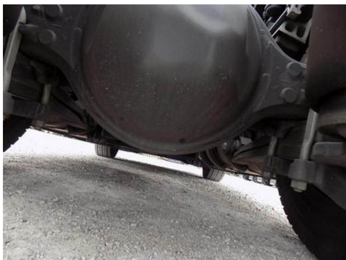
Fot. nr 45