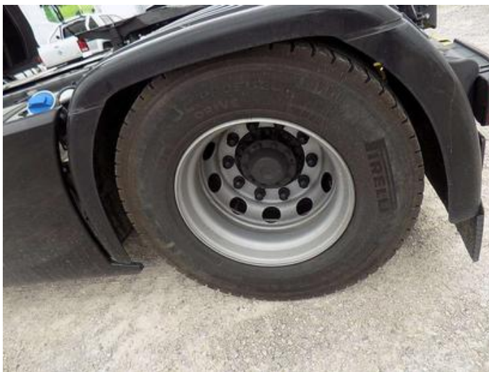
Fot. nr 42