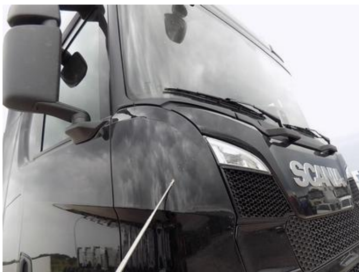
Fot. nr 34