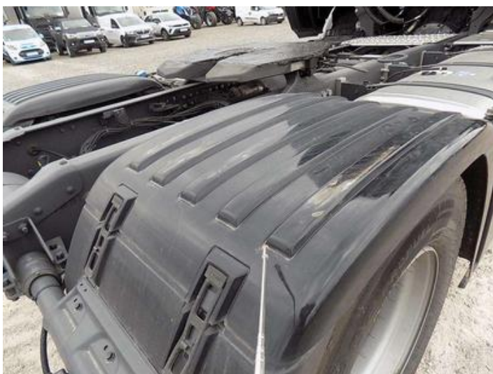
Fot. nr 40