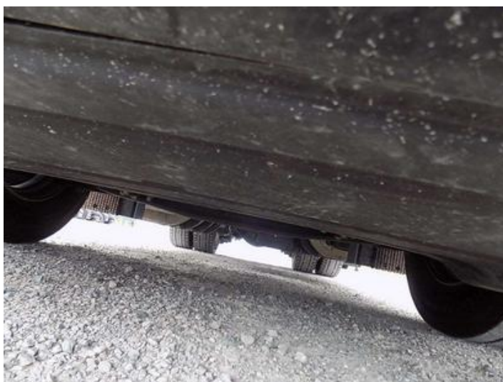
Fot. nr 46

Dokument wystawiony elektronicznie, wa ny bez podpisu