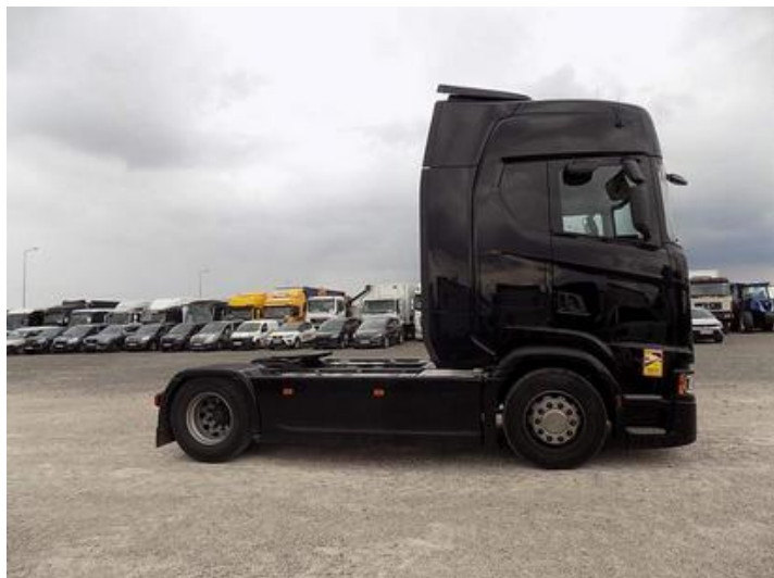
Fot. nr 43