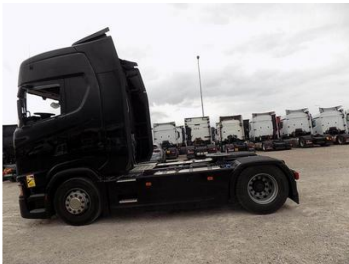
Fot. nr 44