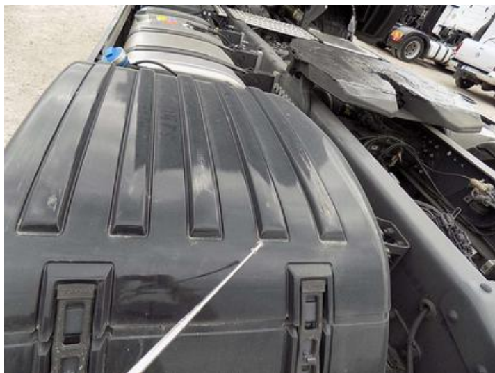
Fot. nr 41