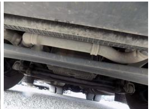
Fot. nr 54

Dokument wystawiony elektronicznie, wazy bez podpisu