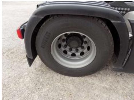
Fot. nr 50