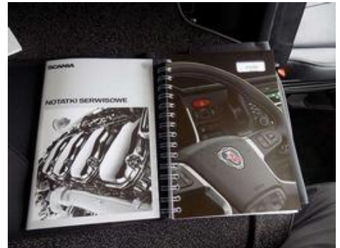
Fot. nr 24