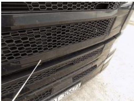
Fot. nr 40