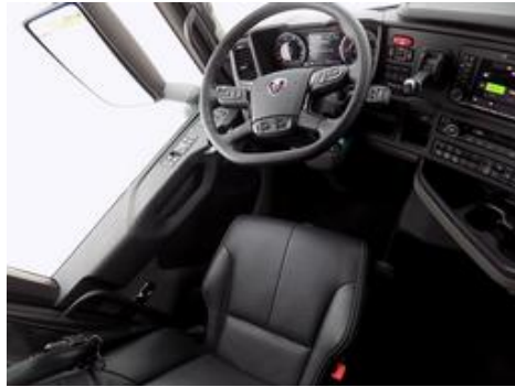
Fot. nr 17