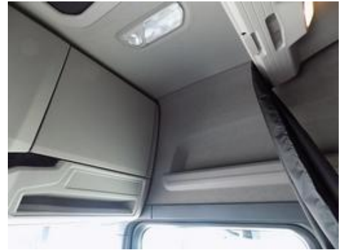
Fot. nr 18