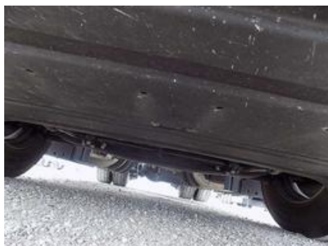
Fot. nr 59