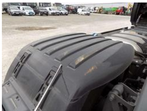
Fot. nr 53