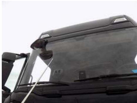
Fot. nr 38