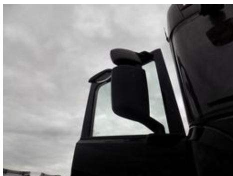
Fot. nr 44