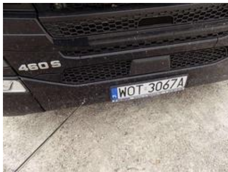
Fot. nr 41