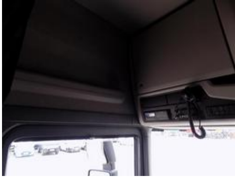
Fot. nr 19