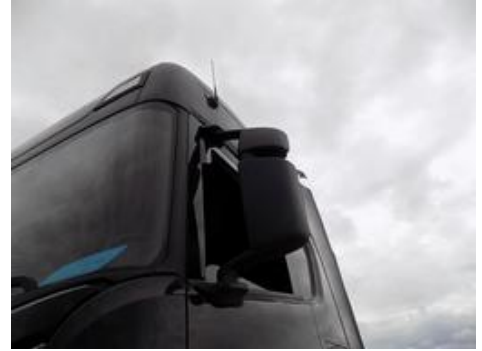
Fot. nr 36