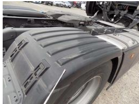
Fot. nr 51