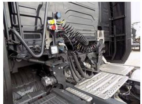
Fot. nr 27