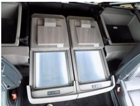
Fot. nr 25