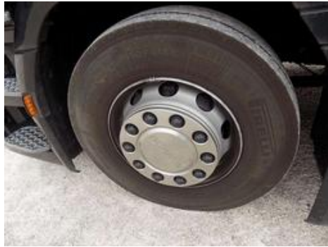
Fot. nr 32