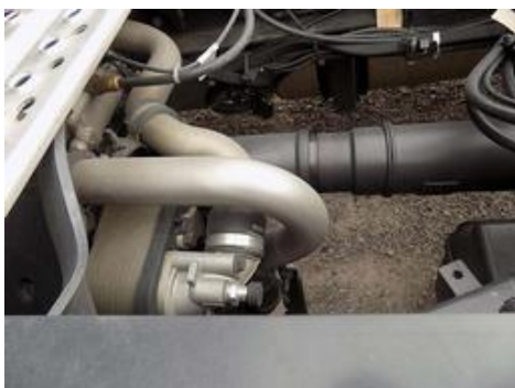
Fot. nr 28