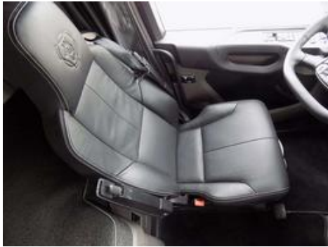
Fot. nr 16