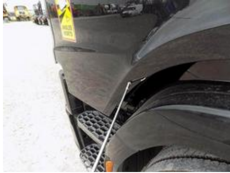
Fot. nr 35