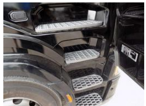
Fot. nr 45