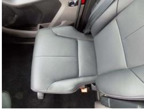
Fot. nr 20