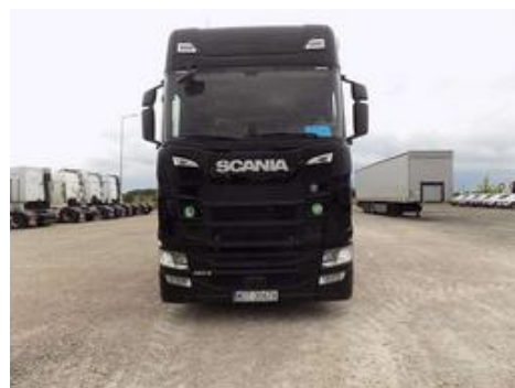
Fot. nr 60