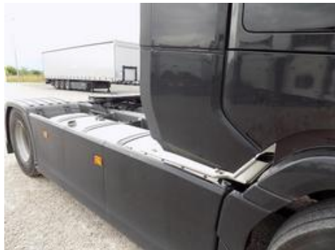
Fot. nr 49