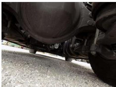
Fot. nr 58