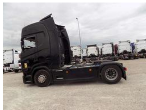
Fot. nr 57