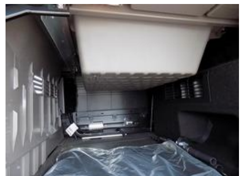
Fot. nr 30