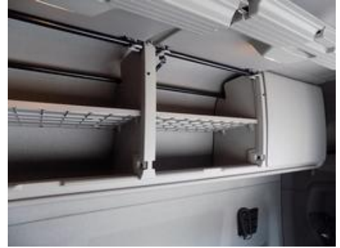
Fot. nr 21