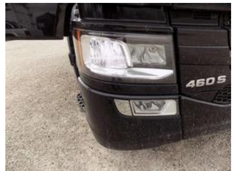
Fot. nr 42