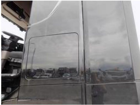
Fot. nr 31