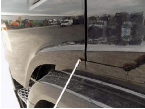
Fot. nr 34