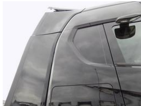
Fot. nr 48