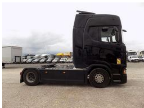
Fot. nr 56