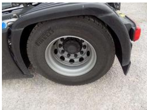
Fot. nr 55