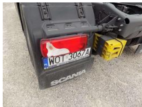
Fot. nr 54