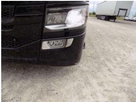
Fot. nr 37