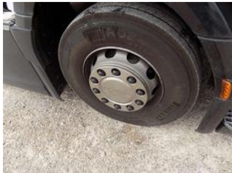
Fot. nr 46