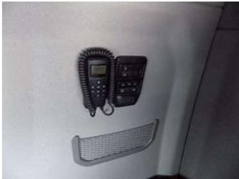
Fot. nr 22