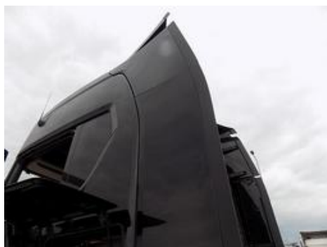
Fot. nr 29