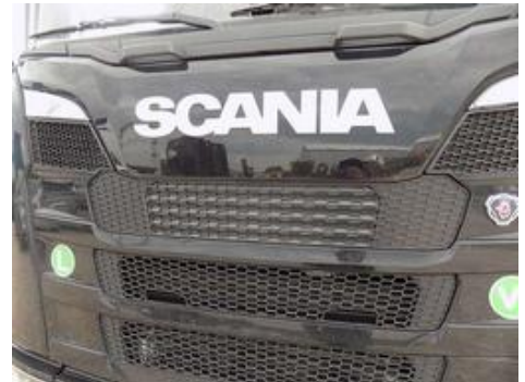
Fot. nr 39