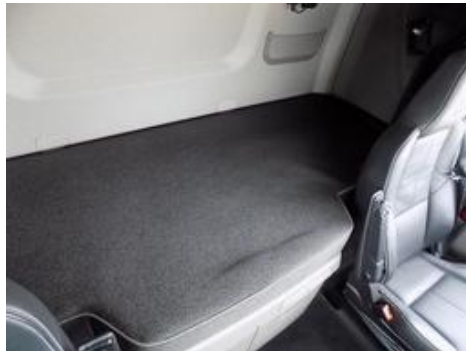
Fot. nr 23