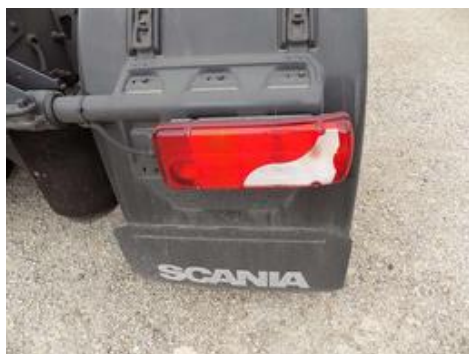
Fot. nr 52