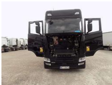
Fot. nr 26