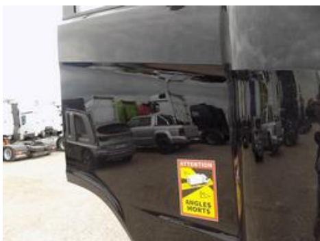
Fot. nr 43