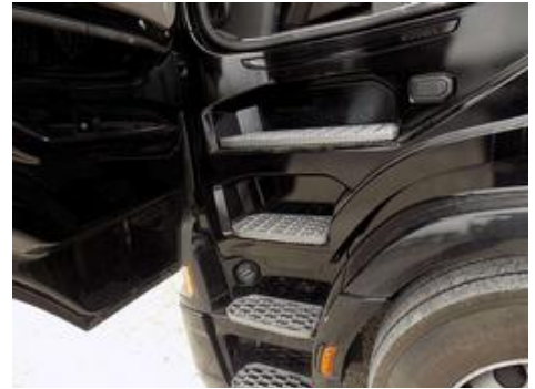
Fot. nr 33