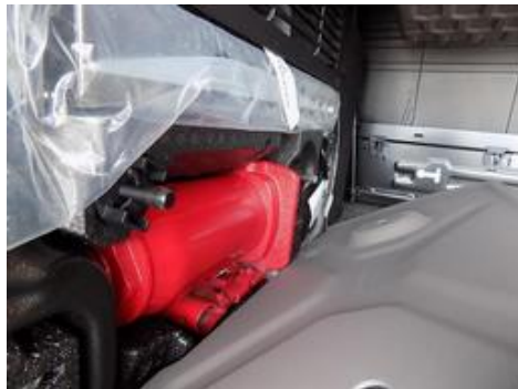
Fot. nr 47